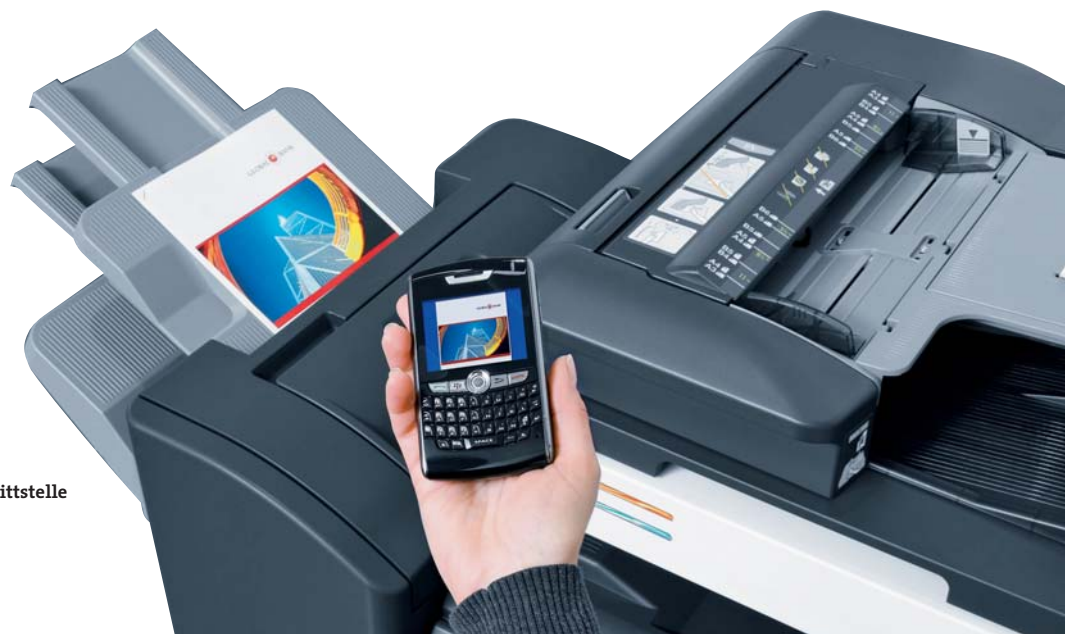
Mobiles Drucken über optionale Bluetooth-Schnittstelle