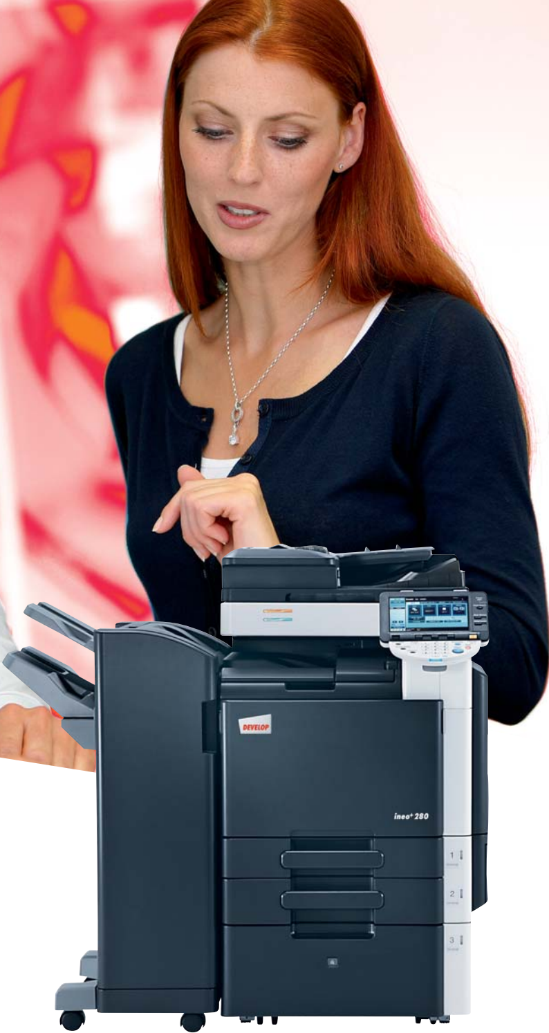
ineo+ 280 mit Origineleinzug (DF-617), Standfinisher (FS-527) und Großraumkassette(PC-408)