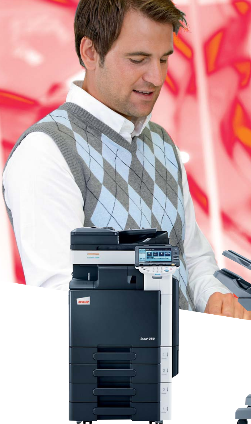
ineo+ 280 mit Origineleinzug (DF-617), Integriertem Finisher (FS-529) und 2 x 500 Blatt Papierkassette (PC-207)